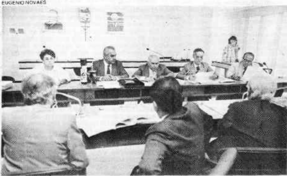
Centrão e Grupo dos 32 reunidos: a constatação de que um precisa do outro

Nenhuma emenda conseguiu 280 adesões e o grupo trabalha dobrado