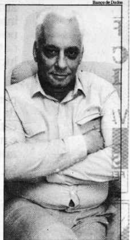
O general Newton Cruz

O preenchimento do cargo vago no comando partidário (pertencia ao senador paranaense Afonso Camargo, que foi para o PTB) é defendido, por exemplo, pelo governador Orestes Quércia (SP), que, no entanto, se opõe a uma definição imediata em relação ao mandato e ao rompimento com o governo. (CR)