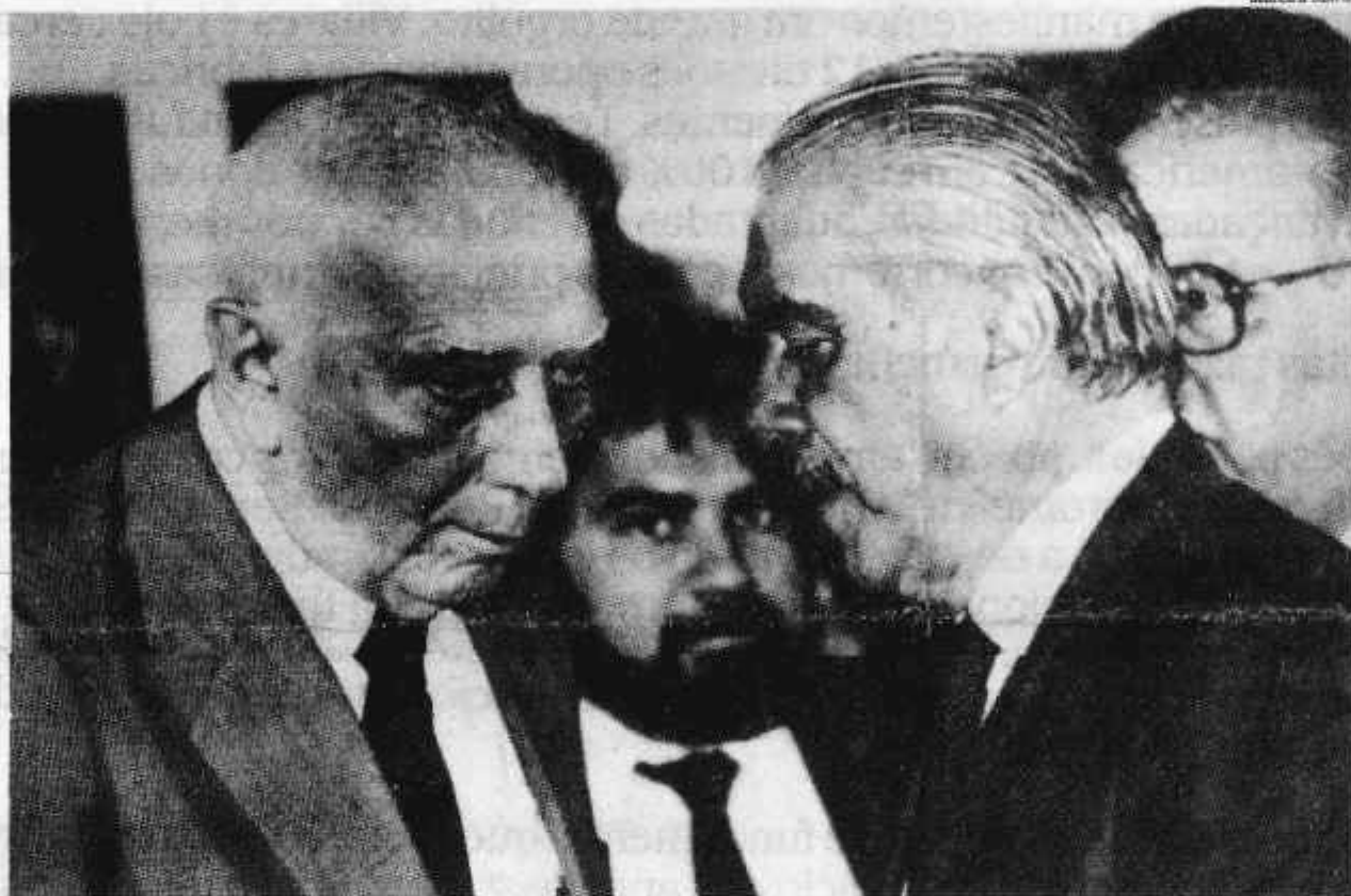
Ulysses e Sarney conversam na residência do governador José Aparecido (DF) em almoço oferecido a Jorge Amado

Como a maioria do Diretório, hoje, não aceitaria a proposta dos "históricos" de romper com o governo Sarney, este grupo teria agora uma