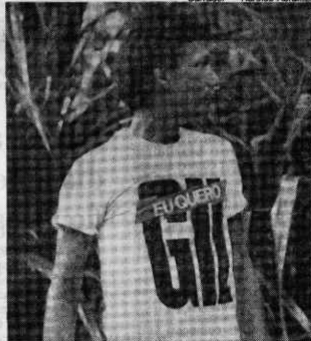
Na camiseta, o apelo eleitoral do cantor