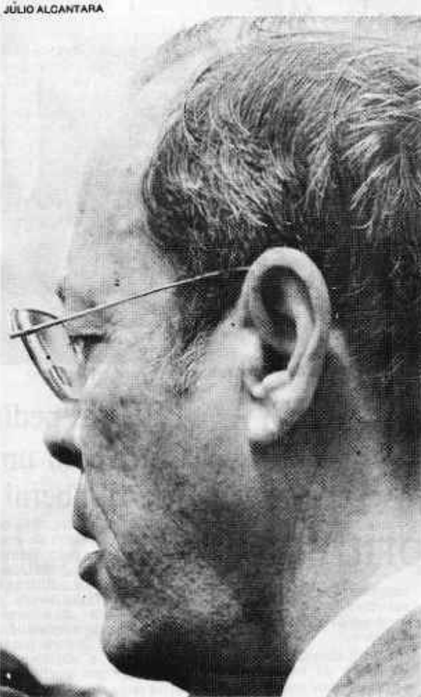
Sant'Anna exige compromisso de quem assinou

numa eleição "casada" com a municipal. No caso, funcionaria a estrutura poderosa do PMDB, cuja legenda ainda possui charme eleitoral.