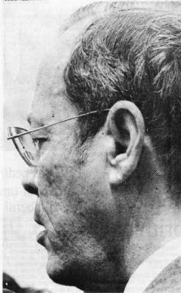
Sant'Anna exige compromisso de quem assinou