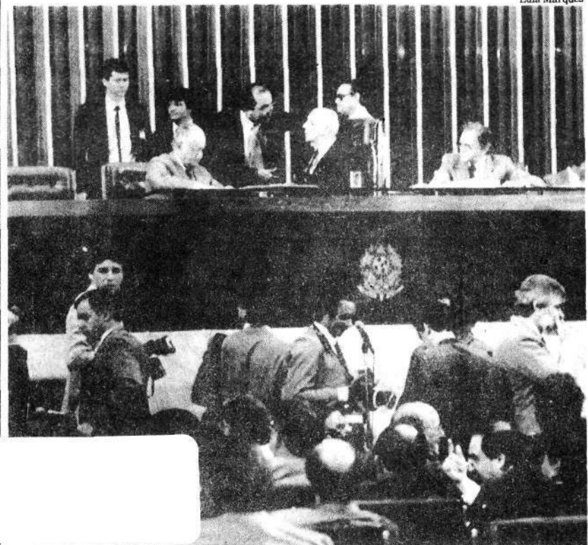
Ulysses Guimarães preside a sessão de reabertura do Congresso constituinte