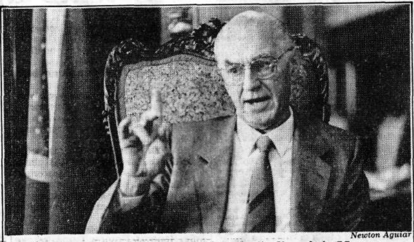
"Poder sem soberania não é Poder", diz o juiz Moraes

Por sua natureza e isenção, o Poder Judiciário não se movimenta nem se mobiliza, mas continua apreensivo em relação à possibilidade existente na Assembléia Nacional Constituinte de aprovação de um órgão destinado a promover o controle externo da Justiça. "Ora, um Poder reprimido em termos de soberania não é Poder" — diz o desembargador Nereu César de Moraes, presidente do Tribunal de Justiça do Estado de São Paulo. Ele esclarece que o Conselho de Justiça, previsto originariamente no projeto de Bernardo Cabral, acabou suprimido no texto aprovado pela Comissão de Sistematização, porém, em face de razões inexplicáveis, há diversas emendas que objetivam ressuscitá-lo.