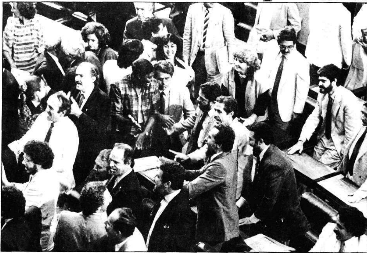
Antes de Ulysses suspender a sessão de ontem, deputados do PT e PDT pediram "Diretas Já"

Sarney aproveitou para agradecer o apoio que tem recebido do governador de Minas Gerais, Newton Cardoso, e disse continuar sendo meta de seu Governo a interiorização do País.