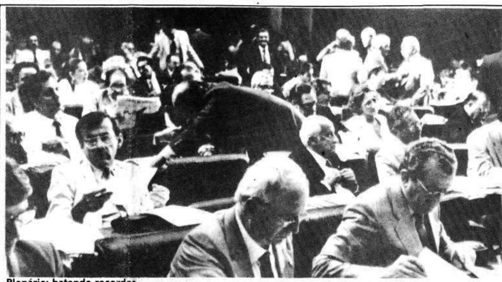
Plenário: batendo recordes.