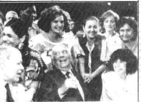
Ulysses e deputadas: homenagem.