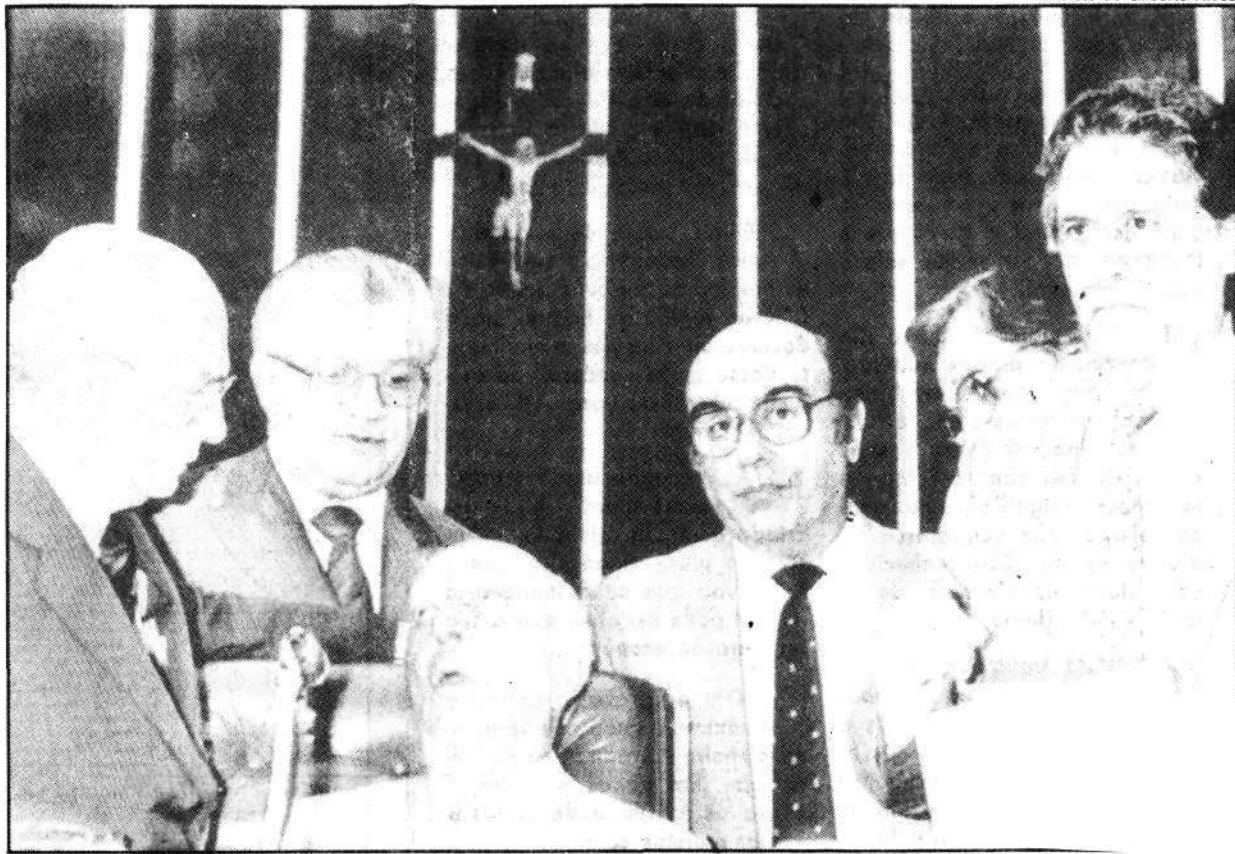
Virgílio Távora (à direita), Benevides, Bonifácio de Andrada, Mário Maia e Fernando Henrique, cercam Ulysses

A noite, o Departamento de Polícia Federal (DPF) anunciou que iniciará investigações para apurar a responsabilidade criminal pela confecção e colocação dos cartazes. O Procurador Geral da República, Sepúlveda Pertence, encaminhou ao Diretor da Polícia Federal, Romeu Tuma, o telex enviado a ele pelo Presidente da Assembleia Constituinte, Ulysses Guimarães, pedindo providências.