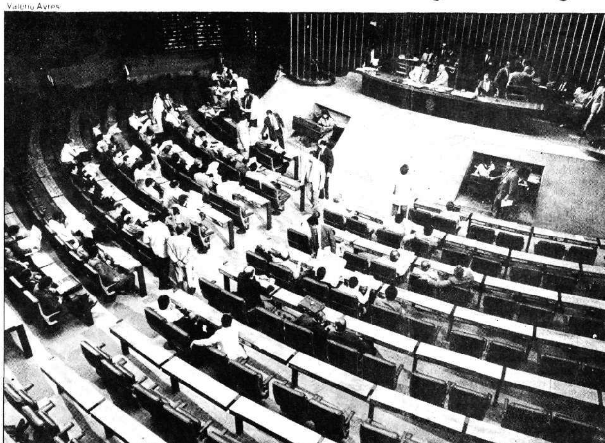
Menos da metade dos 559 parlamentares compareceu à sessão convocada para ontem

Normalmente comedido, Waldir respondeu duro às críticas do presidente Sarney ao seu desempenho, tanto à frente do Ministério da Previdência Social como na condução do governo da Bahia. Em sua réplica, o governador baiano afirmou que Sarney havia reincidento "na lamentável postura de abdicar da responsabilidade da mais alta função da República para responder colocações políticas com ofensas pessoais".