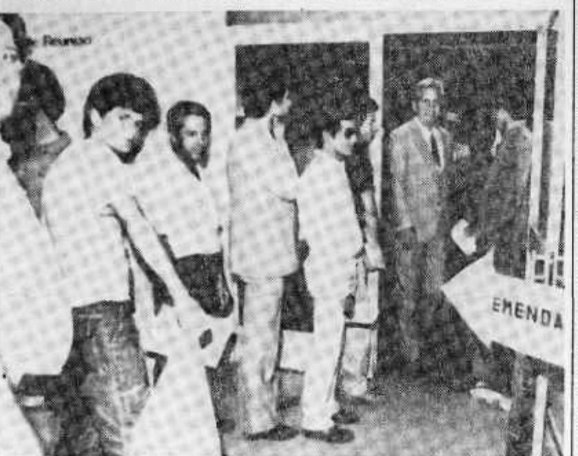
No último dia para apresentar emendas, as filas

O ministro da Saúde, Borges da Silva, que esteve ontem em São Paulo, não conhece em profundidade as propostas constitucionais envolvendo o setor, mas acredita que “deveria haver uma convivência pacífica entre o setor privado e o público já que o governo não tem condições de arcar com todo o sistema sozinho”. Mesmo assim, ele enfatizou que é necessário uma coordenação fiscalizadora do governo na participação da iniciativa privada no setor de saúde.