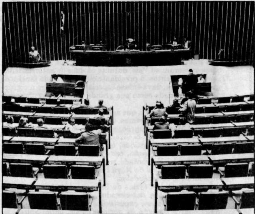
Regime de governo movimentou o plenário da Constituinte ontem

A parte as razões doutrinárias ou políticas, podem ser citadas igualmente as razões de ordem pessoal, simbolizadas por exemplo, no projeto do ex-governador Leonel Brizola de chegar à Presidência para executar um programa de governo imune, como é do seu estilo e temperamento, a influências de forças políticas que dele dirijam. (Marcondes Sampaio)