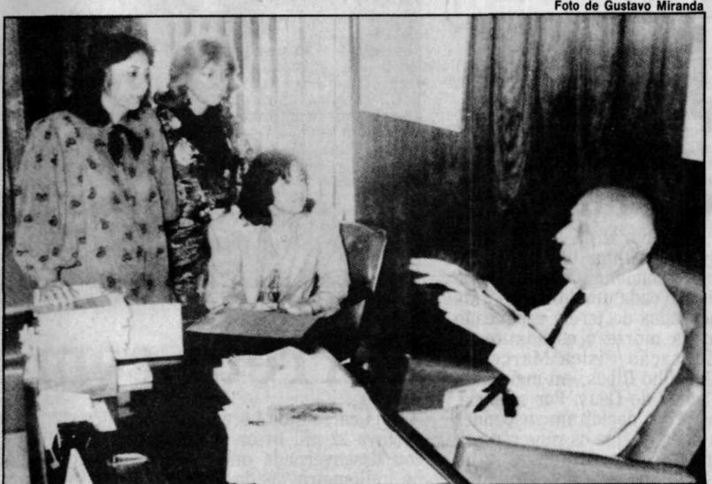
Ulysses Guimarães recebe as Deputadas Maria d'Abadia, Lúcia Braga e Ana Maria Rattes

A urgente realização da reforma agrária e os problemas da urbanização acelerada, que levou 72% da população para as cidades, além de uma ampla defesa da autonomia municipal, são outros itens do docu-