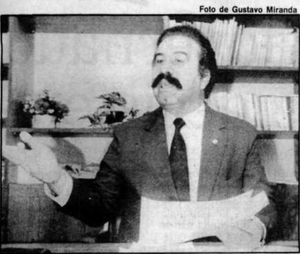
Theodoro admite seu entendimento com o Governo

Para ele, o presidencialismo nos moldes da emenda Theodoro Mendes terá pouca adesão dos constituintes porque "não surgiu da negociação e nesta Casa não se faz nada sem negociar". Expedito não quis explicitar o porquê da sua