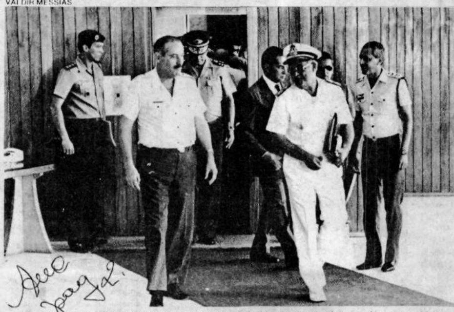
Os ministros militares deixam o ministério da Aeronáutica, após a reunião

As novas medidas, se aprovadas — segundo o ti-