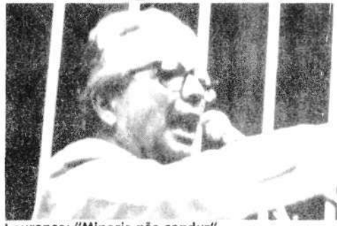
Lourenço: "Minoria não conduz".

Lourenço insistiu que o PMDB "converteu-se no partido do quero, posso e mando" e desafiou Ulysses a agir democraticamente