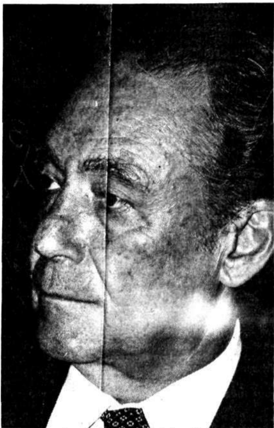
Governador acha que divisão não resolverá

Será garantida pelo Estado a absoluta privacidade do indivíduo em sua vida civil, sendo vedado por quaisquer órgãos o fornecimento de informações de caráter pessoal, a não ser por requerimento da Justiça. Todo o cidadão terá acesso gratuito às informações a seu respeito, conclui o anteprojeto.