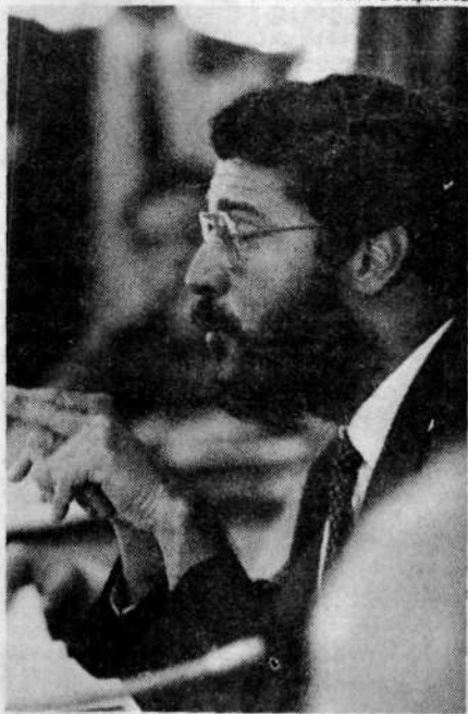
Ministro lembra Abraão Lincoln

E apesar das tensões que marcaram a reunião de ontem da Sub-