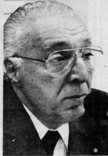
Fiesp considera relatório inadequado