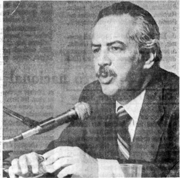
Coelho: fim da política do pires na mão