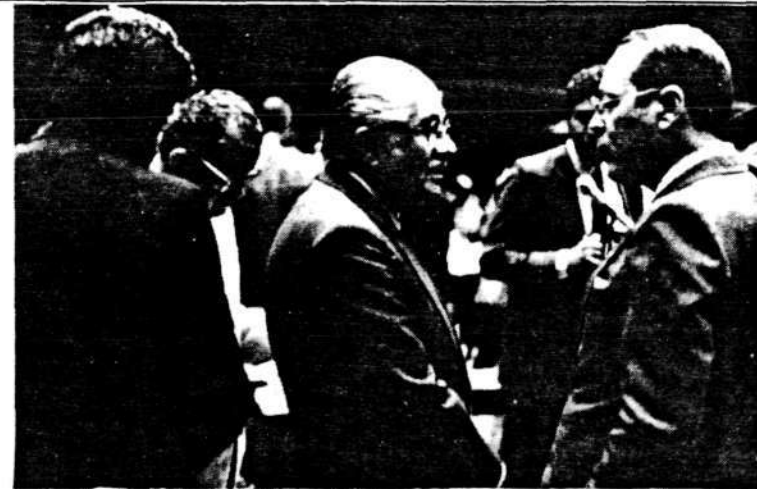
... fim dos trabalhos na Sistematização.

A Mesa da Constituinte reúne-se hoje para aprovar o calendário dos seus trabalhos. Outra questão a ser tratada é a alteração do próprio regimento, que passa pelo projeto de resolução do Centrão e pelo substitutivo de Mauro Benevides.