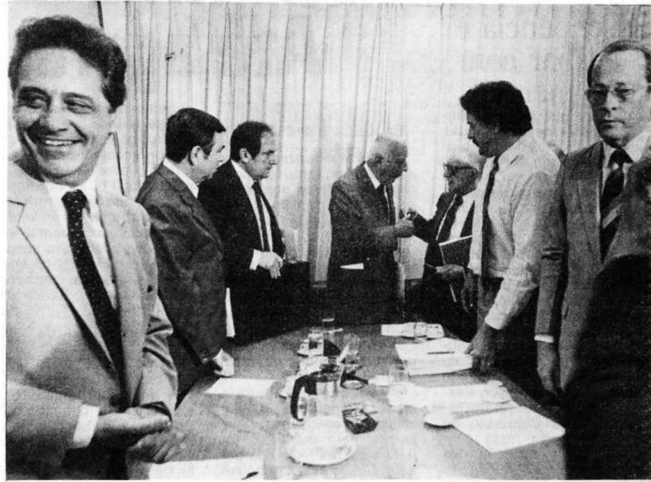
Relatores-adjuntos e membros da cúpula fazem o trabalho a portas fechadas