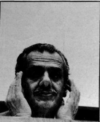
Governador lamenta vitória