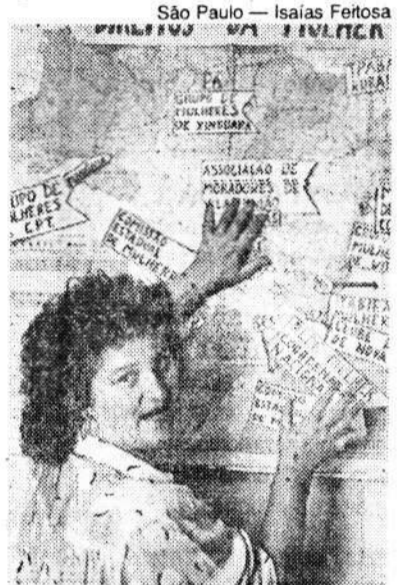
Moema: pela consciência