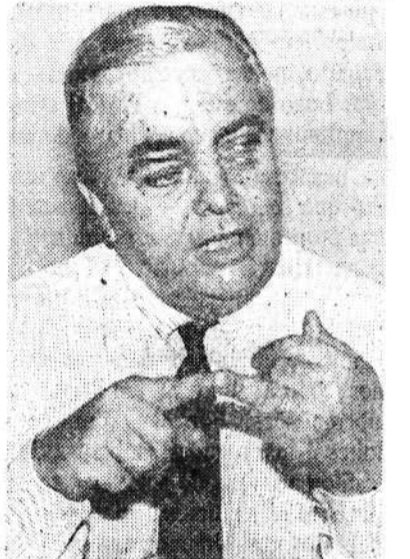
Massá: o filho é sagrado

— Eu chamo a atenção para a responsabilidade dos pais. Filho é uma coisa sagrada, que precisa do nosso carinho e do nosso apoio. O governo, como também a comunidade, têm o dever de orientar e conscientizar os pais sobre esta realidade. Temos que lutar pela sobrevivência da família.