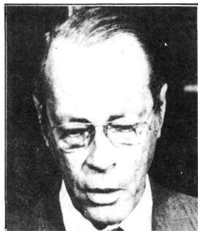
Sant'Anna: "Fator de crise".