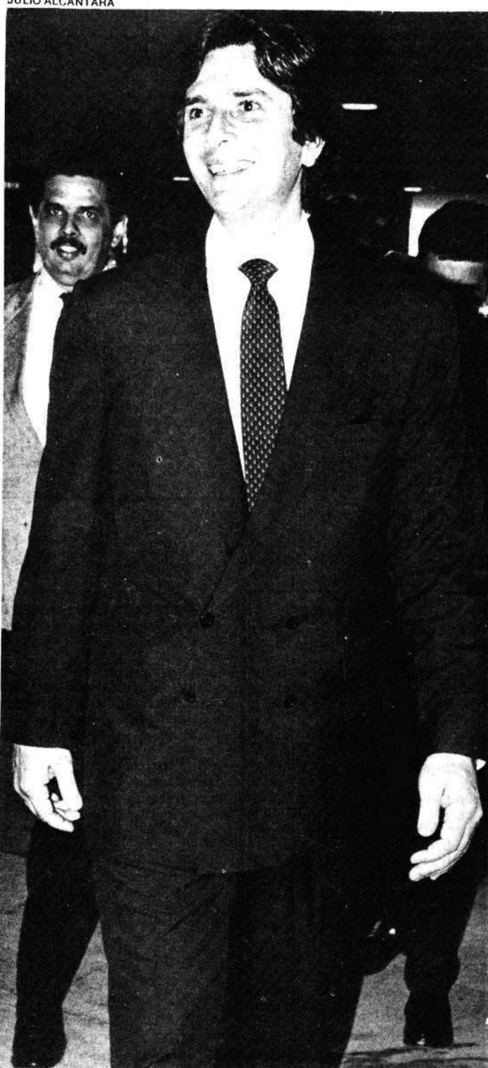
Pazes feitas, Collor deixa sorridente o Planalto

Mesmo após a pacificação e da crença de que o Governo logo vai agir, o governador de Alagoas continua achando que está faltando ação às autoridades econômicas: "Há um ditado popular que diz — o que se predica tem que se praticar. Acho que é o caso. O ministro da Fazenda, Bresser Pereira, precisa agir mais rápido, adotar as medidas corretas", afirmou Fernando Collor.