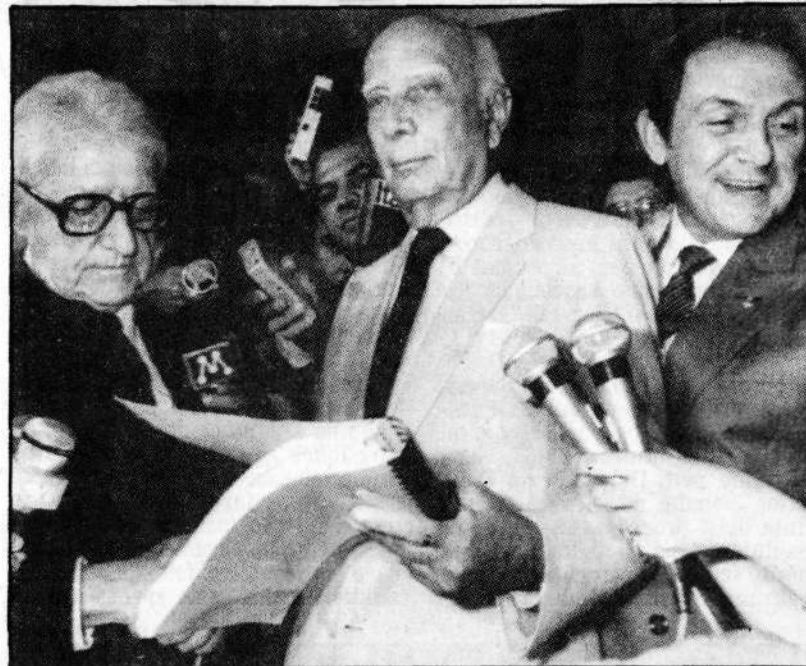
Ao lado de Cabral, Ulysses recebe de Arinos o anteprojeto da Carta

O Presidente da Constituinte fez longos elogios ao Senador Afonso