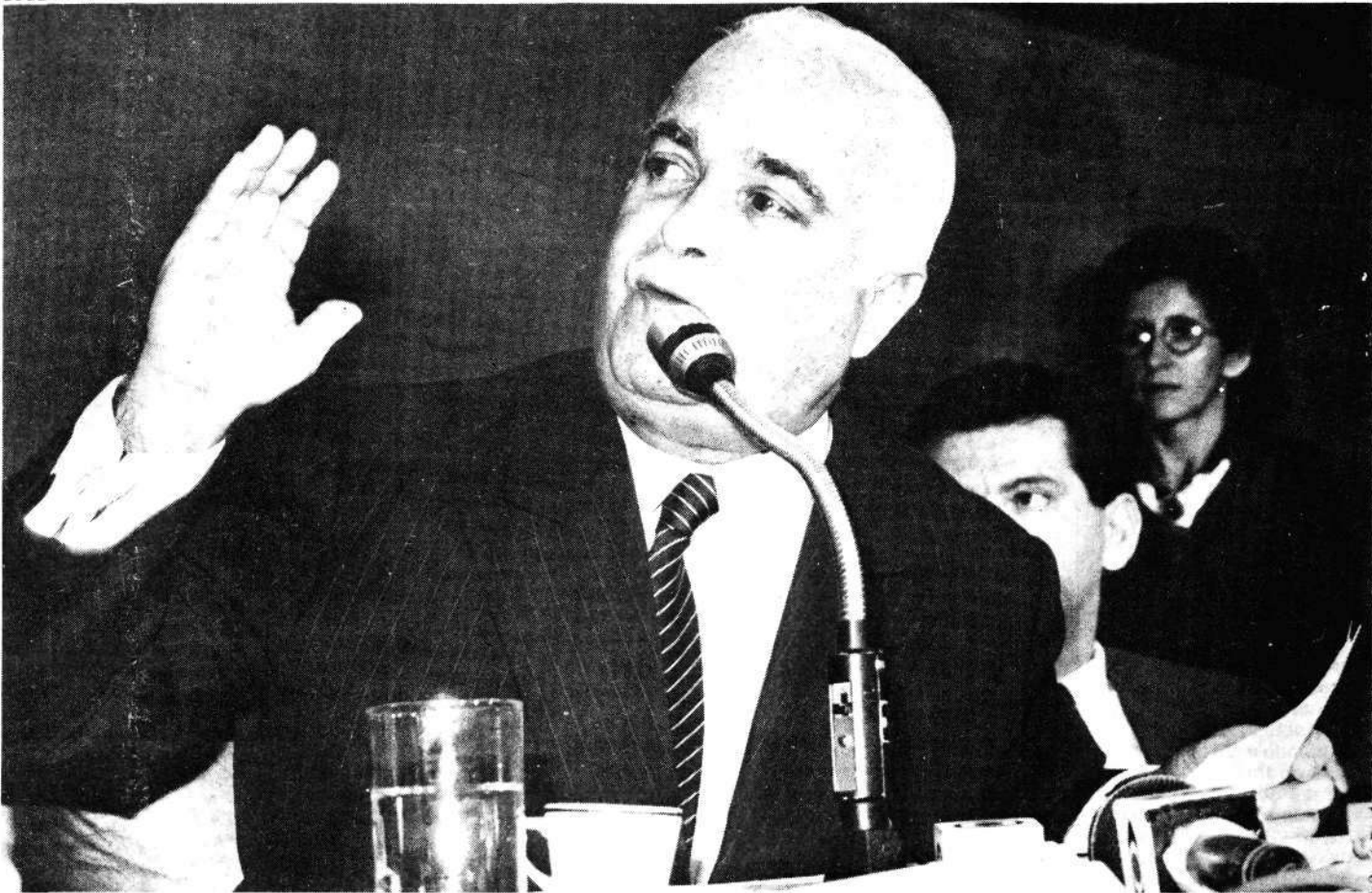
Em debate com os constituintes, Antônio Carlos Magalhães fez um resumo do progresso no setor de telecomunicações