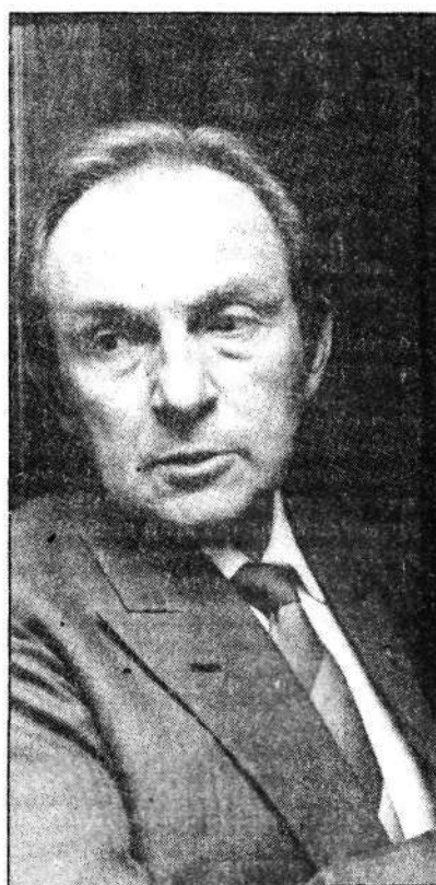
Cabral é acusado de impor parlamentarismo já para evitar que Brizola suceda Sarney

O substitutivo, no entanto, dá amplos poderes ao Congresso Nacional para legislar sobre o orçamento da União, embora acene com o decurso de prazo caso o orçamento não seja votado até o encerramento do período legislativo.