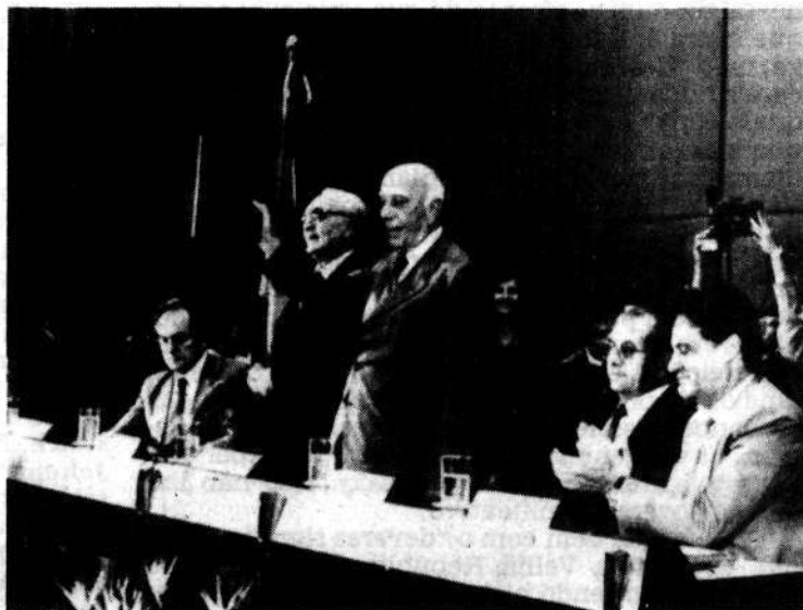
Ulysses: votar logo.

O problema, agora, é convencer os componentes do Centrão da necessidade de não sair de Brasília — "ou tudo irá por água abaixo", advertiu o líder do PDS, deputado Amaral Neto. "Se não estivermos unidos, poderemos ser derrotados e cairemos no ridículo."