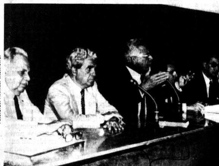
Centrão: união e temor.

A Mesa da Constituinte decidiu acolher 11 das 45 emendas apresentadas à sua proposta de alteração regimental, mas não conseguiu contentar o Centrão — que hoje tentará fazer valer no plenário a sua força majoritária.