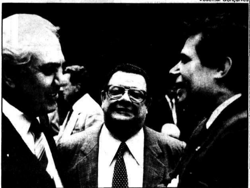
Delfim, entre Richa e D'Ávila, diz para Sarney não interferir

Um desses temas — admitiu ele — é a redução da jornada de trabalho. "Por sinal — declarou