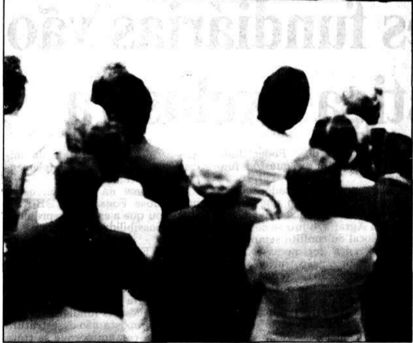
Ulysses (C) tenta evitar a apresentação de novo substitutivo