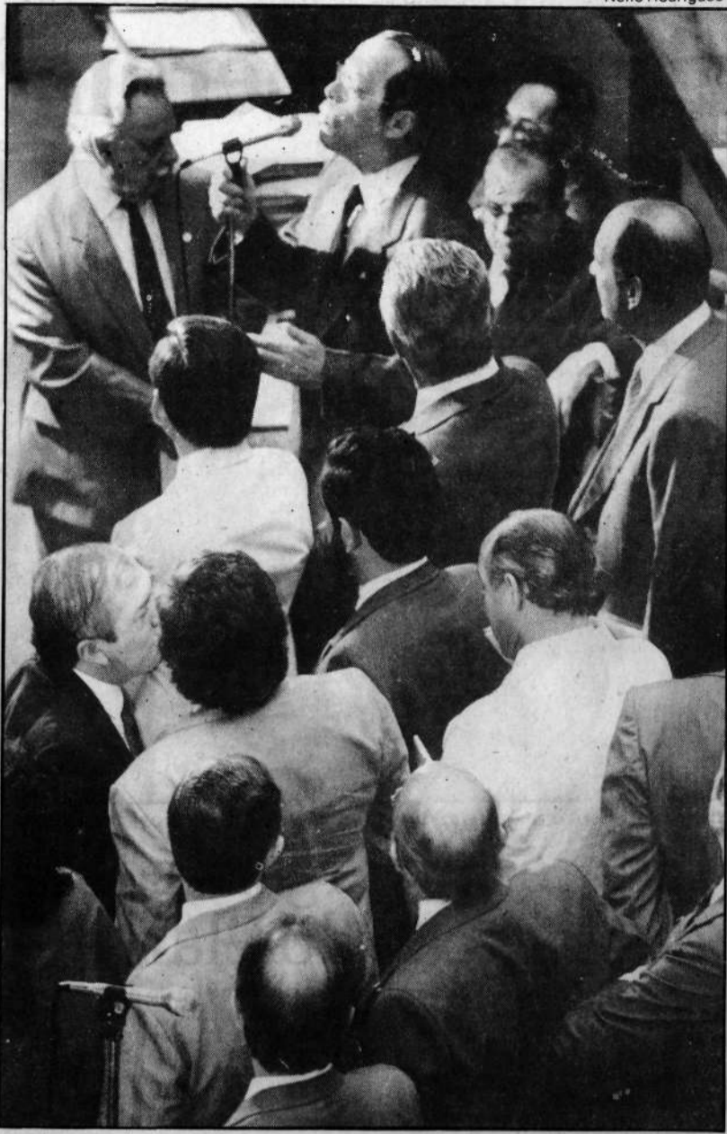
Ponderações de Sant'Anna não foram aceitas por constituintes

"Essa é questão de análise subjetiva das pessoas. Penso que os parlamentares têm o direito de votar quatro anos se quiserem. Acho que o presidente não tem essa postura de ressentimentos, porque isso não é construtivo. Não acredito que o presidente tenha esse pensamento. Acho que houve algum equívoco de informação".