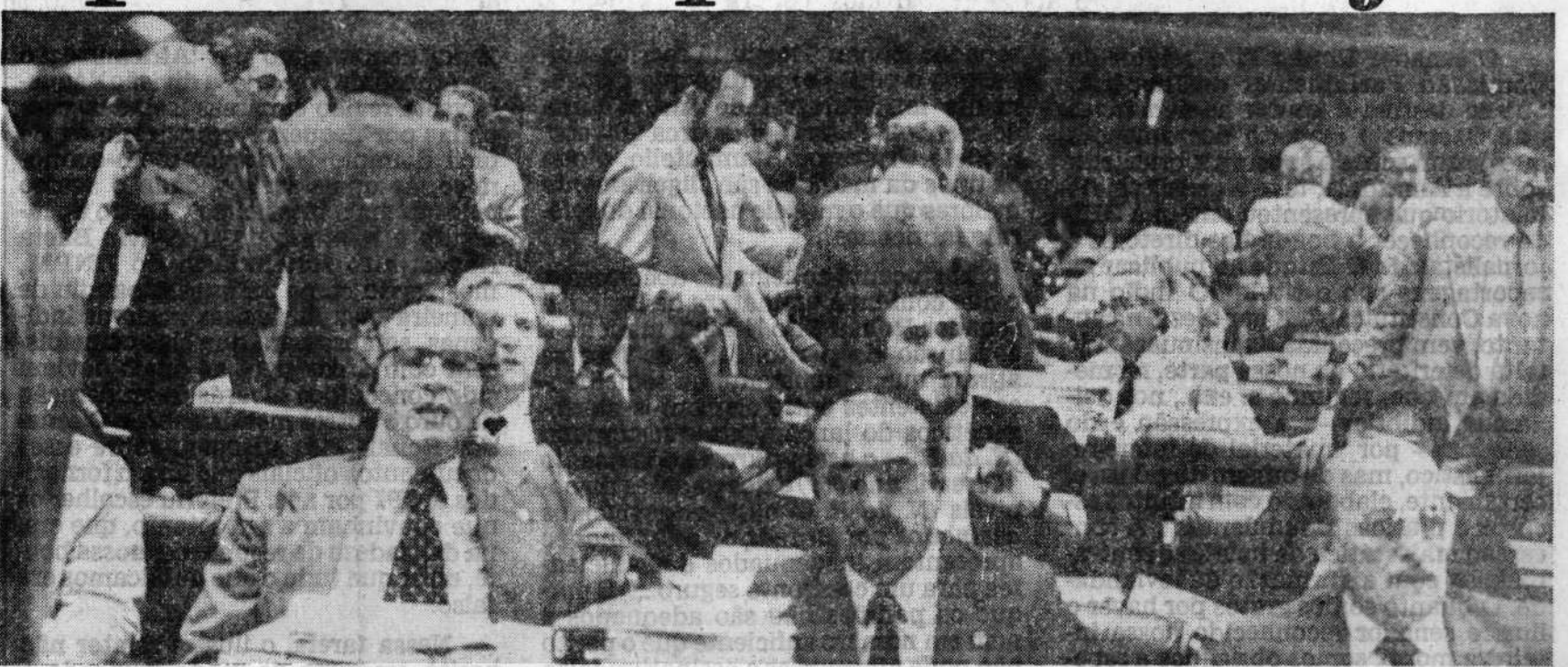
Tumulto, questões de ordem, votações. Mas a Sistematização não passou do artigo 6º