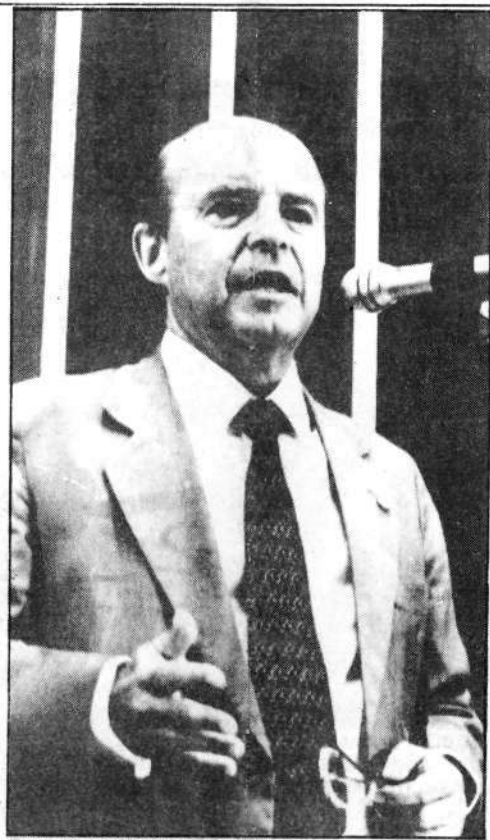
Dornelles: liberdade econômica.

Convidado pelo relator Bernardo Cabral para atuar nessa matéria como relator-adjunto, o senador Virgílio Távora (PDS-CE) manifestou-se contra a emenda, alegando que o texto do substitutivo reproduzia o conceito de empresa nacional que consta da Lei de Informática. "Durante os três anos de vigência dessa lei — acrescentou — verificamos que a conceituação é boa e dá os resultados práticos almejados."