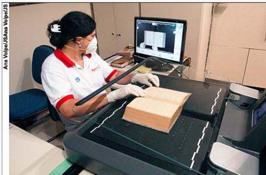
Funcionária digitaliza obra da coleção da biblioteca: 340 das 6,5 mil obras raras estarão na internet a partir desta terça

Biblioteca da Casa adere nesta terça-feira ao maior e mais respeitado catálogo internacional que permite buscas pelo Google e outros mecanismos