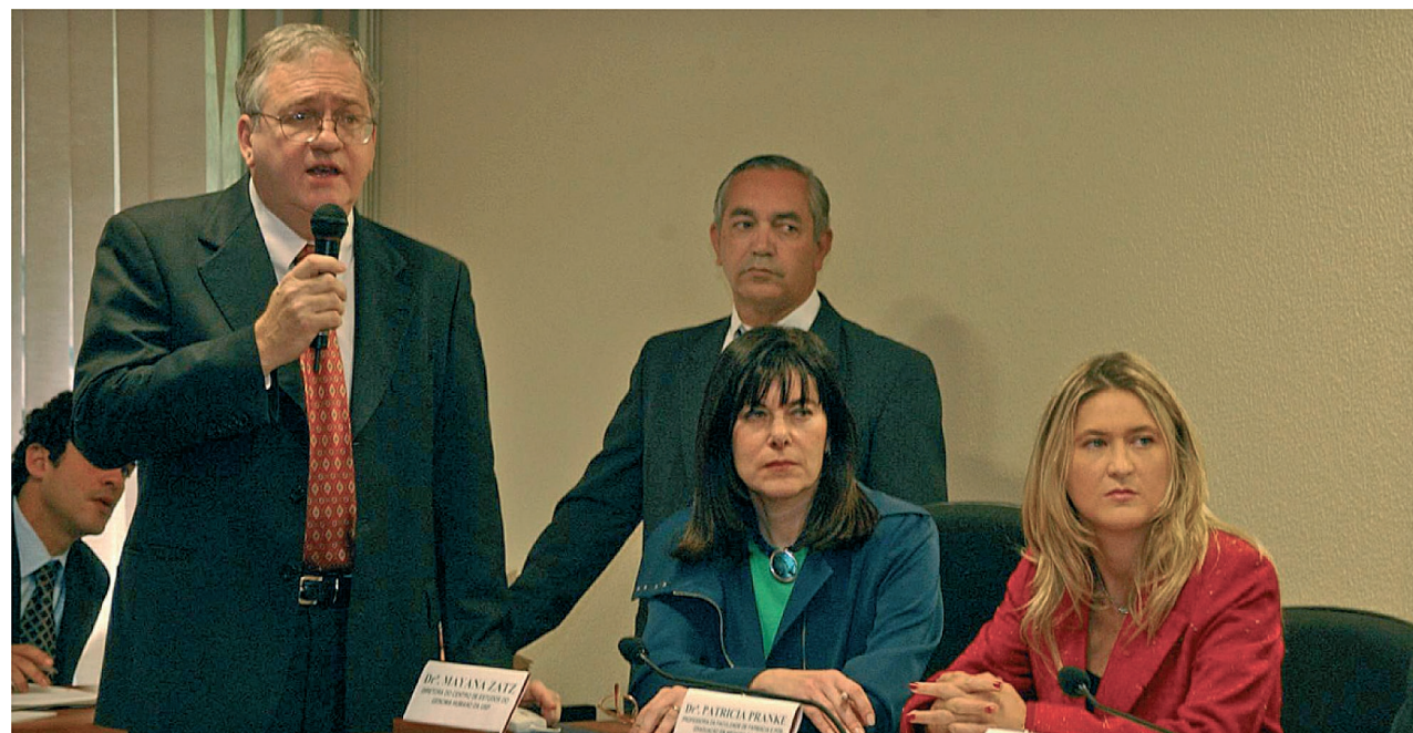
Cientistas debatem o projeto da Lei de Biossegurança em audiência pública

Marcelo Yuka, ex-baterista do grupo O Rappa