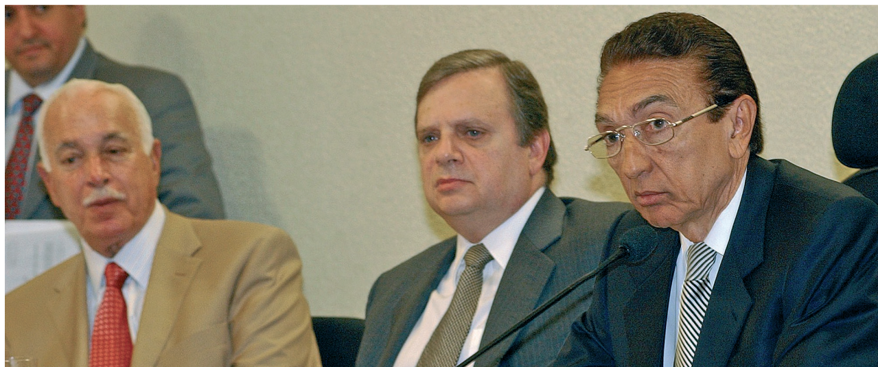
Senadores Antonio Carlos Magalhães, Tasso Jereissati e Edison Lobão durante debate do projeto na Comissão de Constituição e Justiça