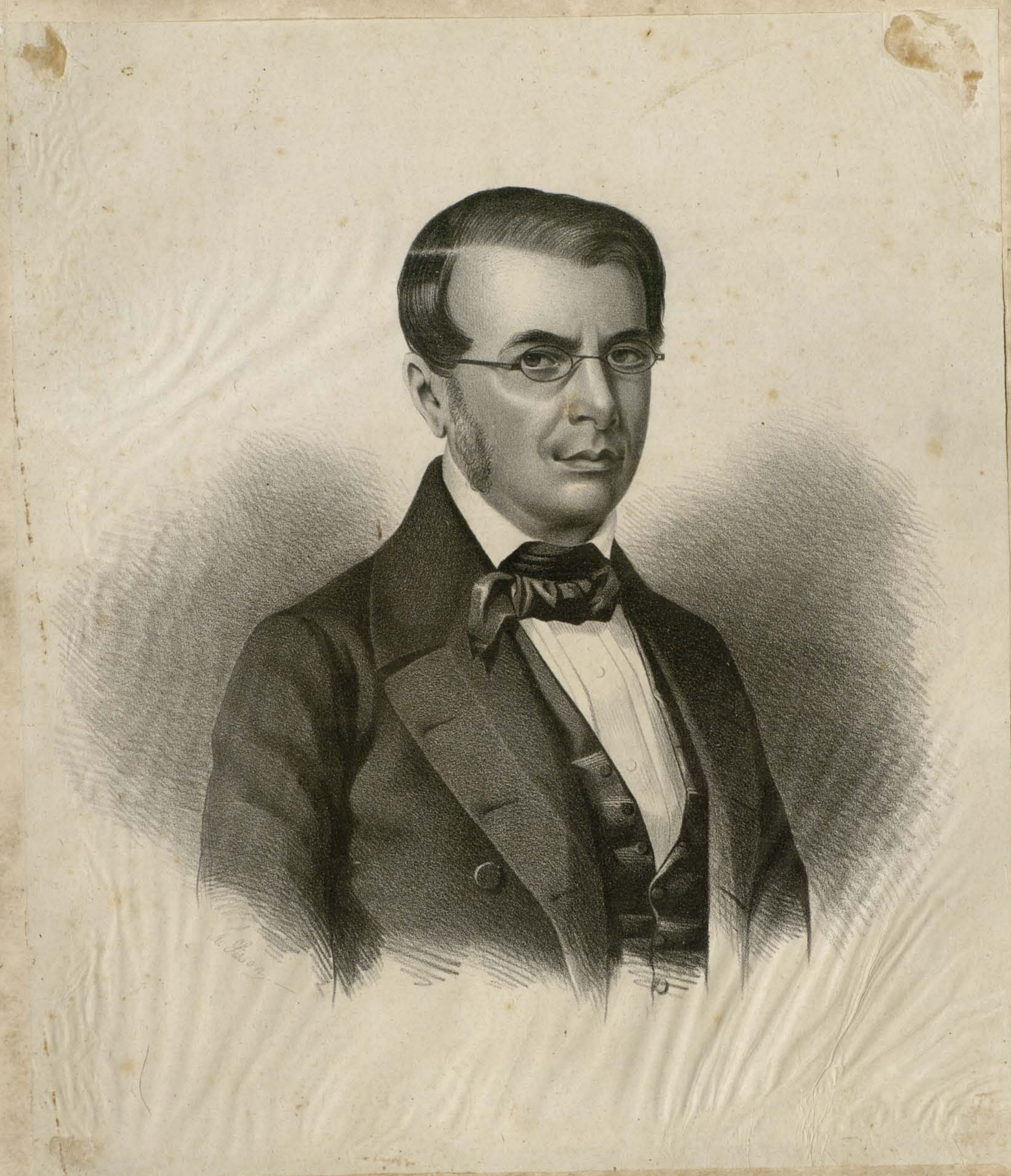
Visconde de Itaboraité