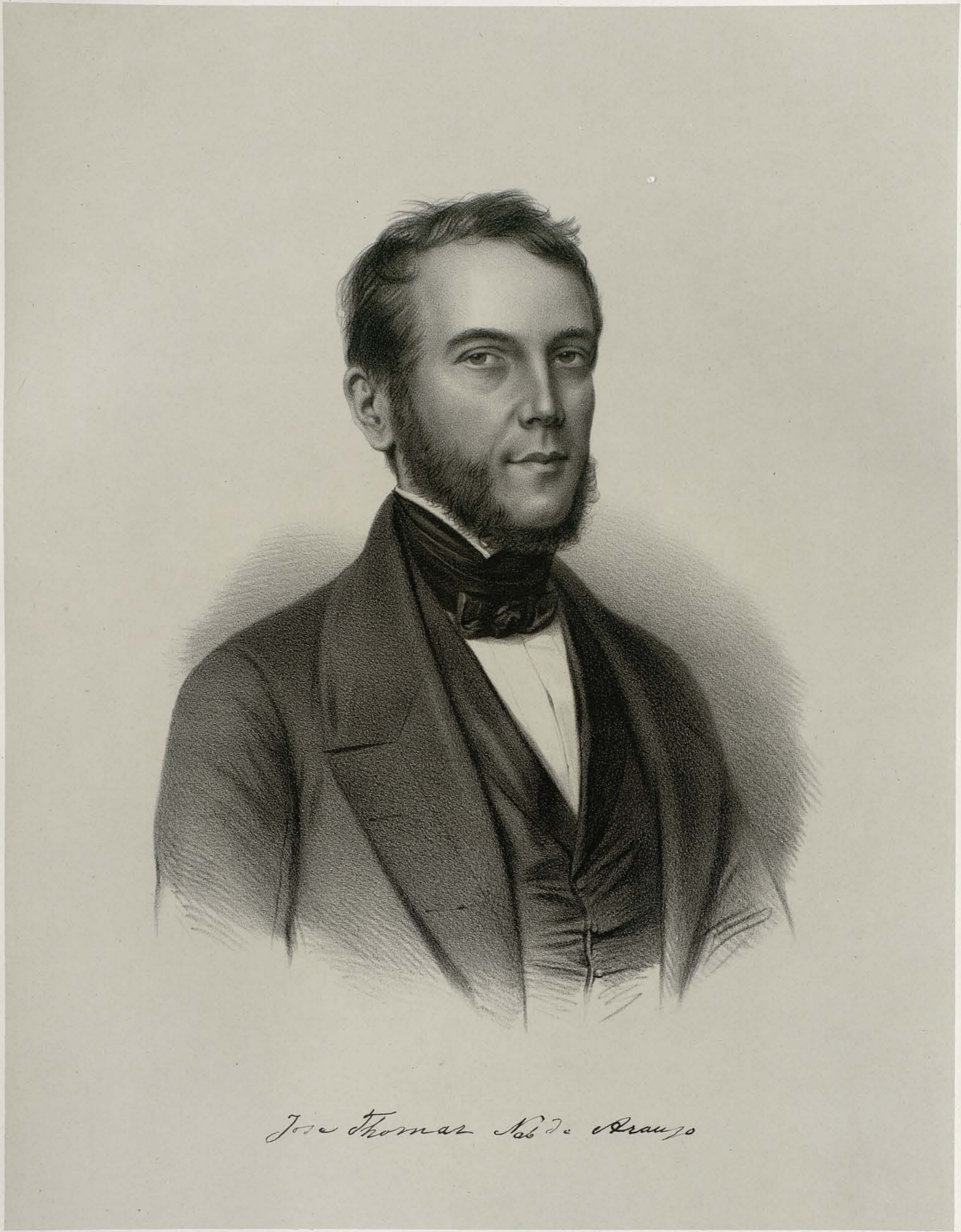
José Thomaz Nabuco de Araújo