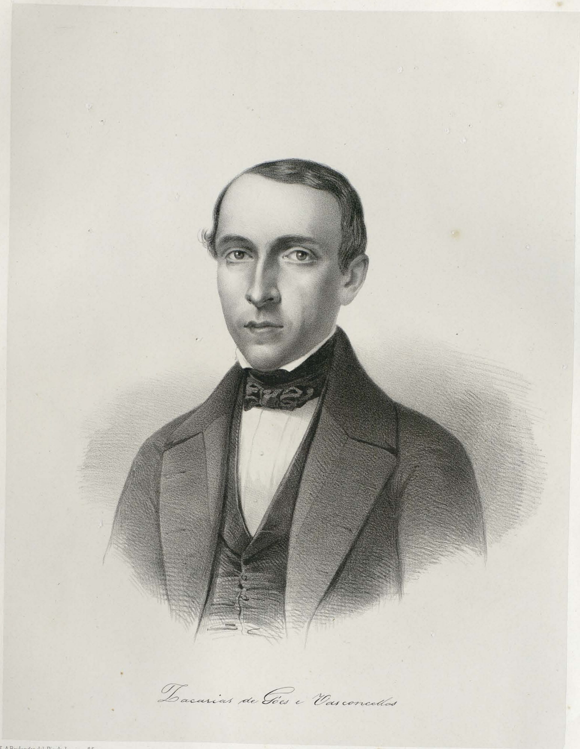
Zacarias de Góes e Vasconcellos

L. A. Boulanger del. Rio de Janeiro 1851