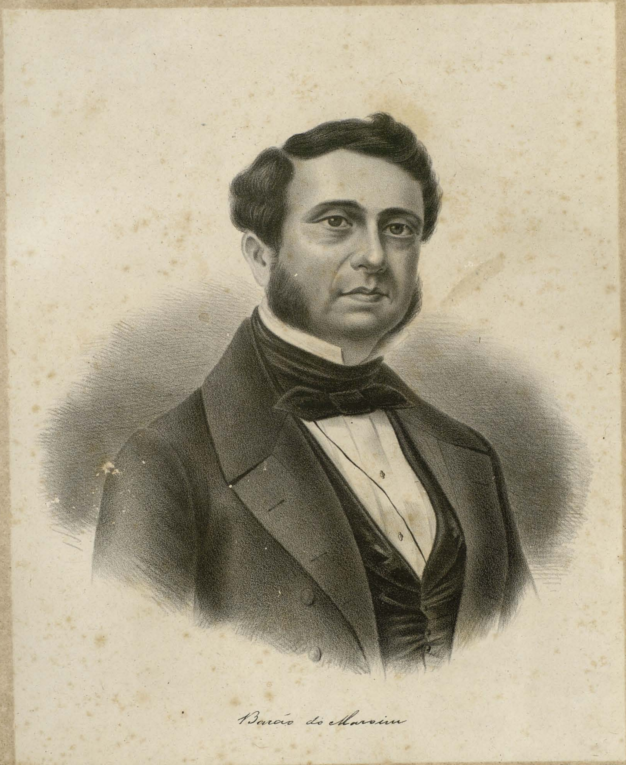
Barão de Maroim