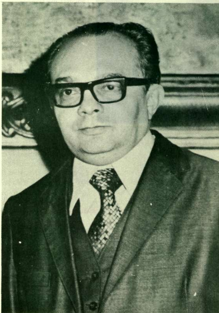
Senador Petrônio Portella Presidente do Congresso Nacional (ARENA-PI)

Em doze de outubro, na solenidade de inauguração do PRODASEN, o Presidente do Congresso Nacional, Senador Petrônio Portella, pronunciou o seguinte discurso: