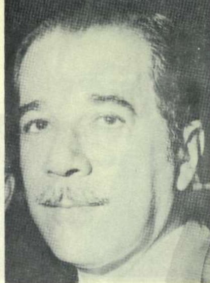
Senador Ney Braga 1º-Secretário (ARENA-PR)