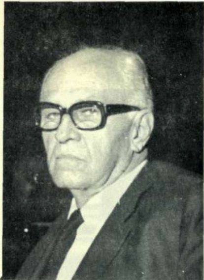
Senador Carlos Lindenberg 1º-Vice-Presidente (ARENA-ES)

A transformação dessa meta em realidade exige a aglutinação de esforços e inteligências, na instrumentação de Instituições que possibilitem alcançar tão almejados e altos objetivos. A nova dinâmica imprimida ao País faz com que os fatos se sucedam mais celeremente. O grande desafio a enfrentar a classe à qual cabe dirigir os destinos da Pátria é manter-se na vanguarda dos acontecimentos, orientando os caminhos a serem trilhados. Para isso, torna-se indispensável a utilização de modernas técnicas e instrumentos de organização e, principalmente, de controle de informações.