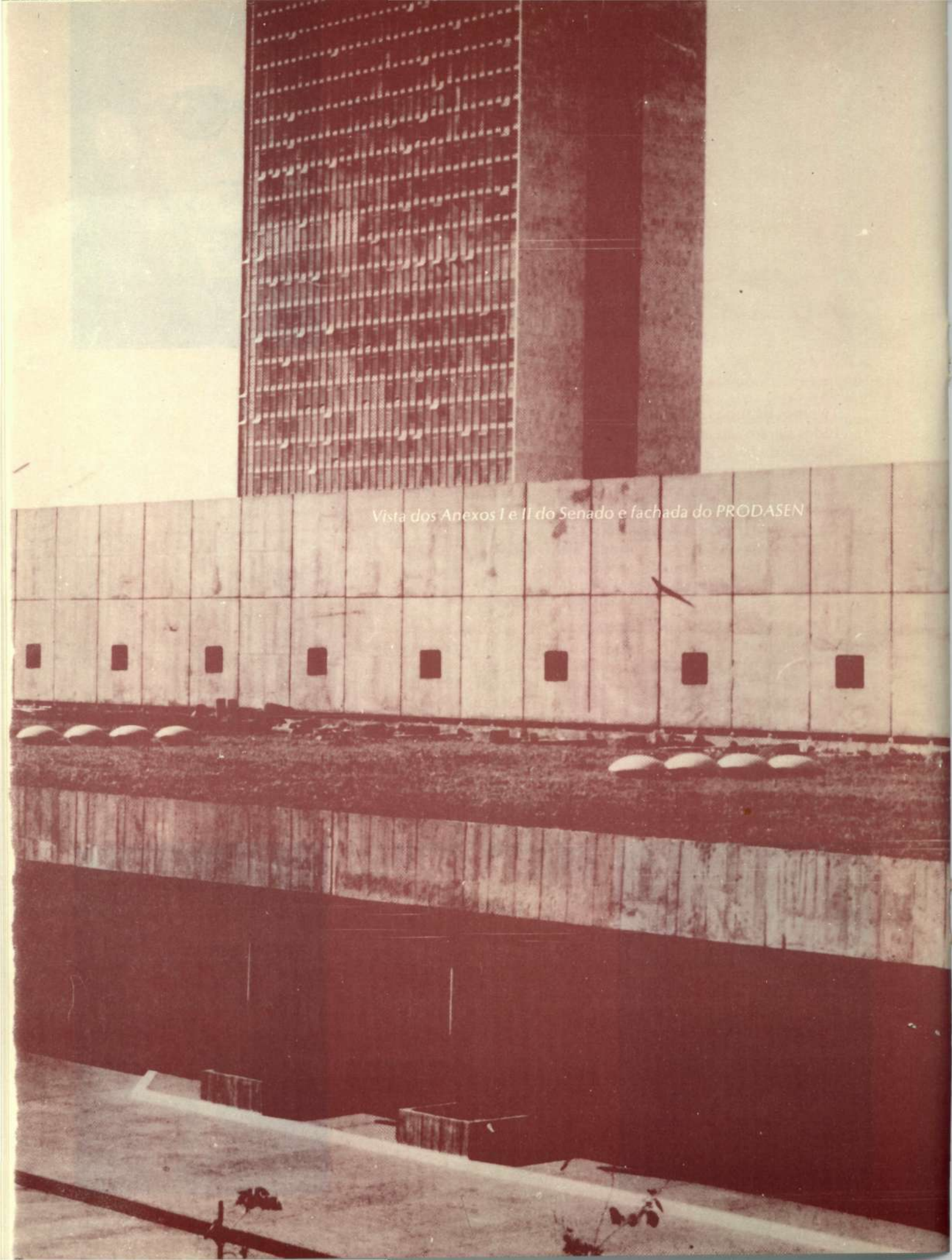
Vista dos Anexos I e II do Senado e fachada do PRODASEN