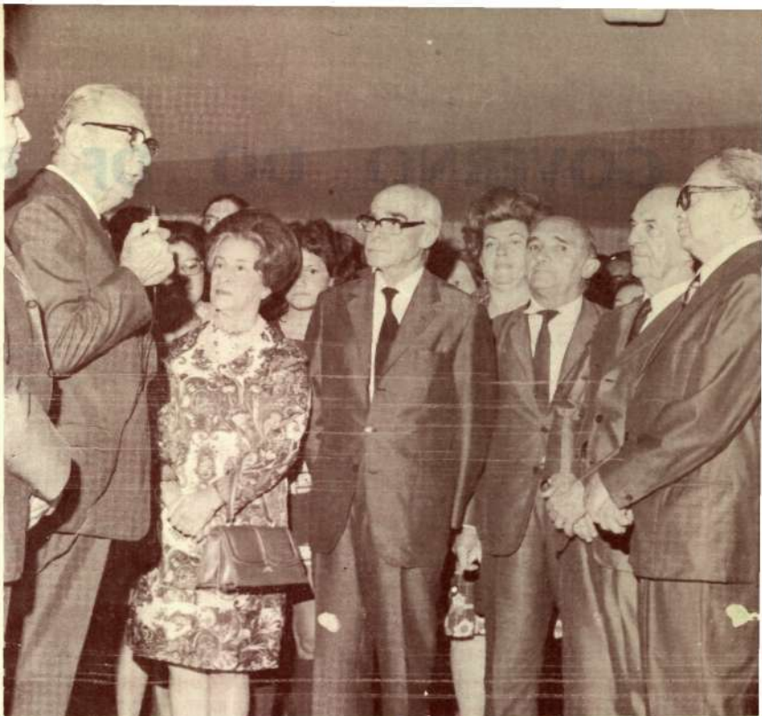
Falou ainda no ato da inauguração, o Presidente Nacional da ARENA, Senador Filinto Müller, dizendo da importância do Centro de Processamento de Dados do Senado Federal para o perfeito encaminhamento das tarefas legislativas.

Estou interessado e acompanhando com bastante curiosidade e responsabilidade o esquema de funcionamento desse novo serviço do Senado Federal".