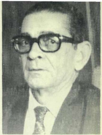
Senador Duarte Filho 4º-Secretário (ARENA-RN)

Tivemos de todos o apoio. Criticando, advertindo, apreciando todos deram seu concurso valioso, indispensável. A partir de hoje, a responsabilidade será maior, pois se divide com todos que tenham a satisfação de, representando o povo, integrar o Congresso Nacional. Que não se espere da máquina o que ela, por si mesma, não pode dar. Da nossa inteligência depende. Trabalhando-a bem, transmitindo-lhe os dados necessários, muito esforço será poupado e um mundo novo de informações estará ao alcance de muitos, enriquecendo nossa Casa e outras Instituições pelas quais o PRODASEN se venha a expandir. Uma etapa vencemos, difícil, pioneira.