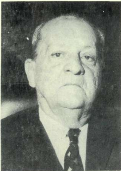
Senador Renato Franco 1º-Suplente (ARENA-PA)

Mas sabemos que o será, porque cremos nos técnicos, nos funcionários, nos Deputados e Senadores, e do esforço, dedicação, sacrifício e luta de todos resultará um sistema que sirva bem à Nação e honre o Congresso.