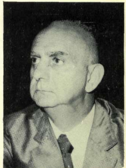
Senador Benjamin Farah 2º-Suplente (MDB-GB)