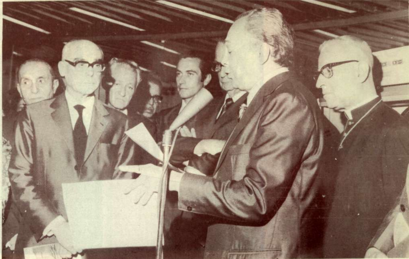
No ato de inauguração do PRODASEN, fala o Senador Petrônio Portella.