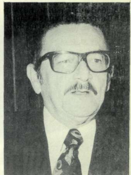
Senador Teotônio Vilela 4º-Suplente (ARENA-AL)