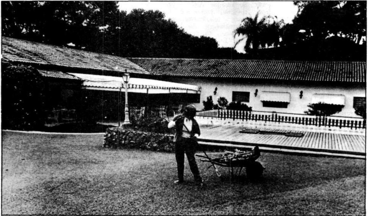
Piscina, jardins e clima ameno para a alergia do presidente