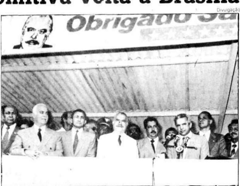
No palanque, Sarney recebeu o título de cidadão honorário

Nenhum dos ministros presentes quis falar à imprensa. Ape-