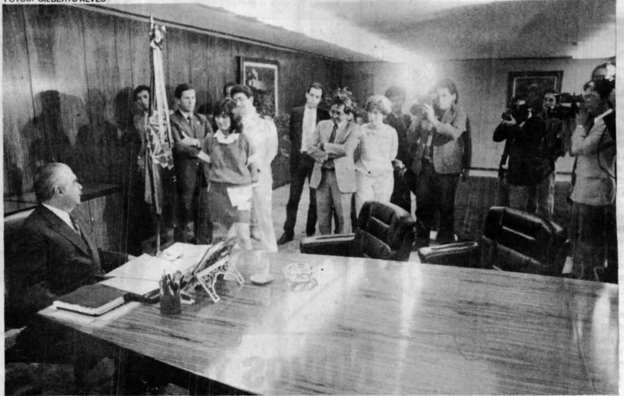
Sarney abre sua sala para a imprensa documentar o seu trabalho solitário no Dia do Funcionário