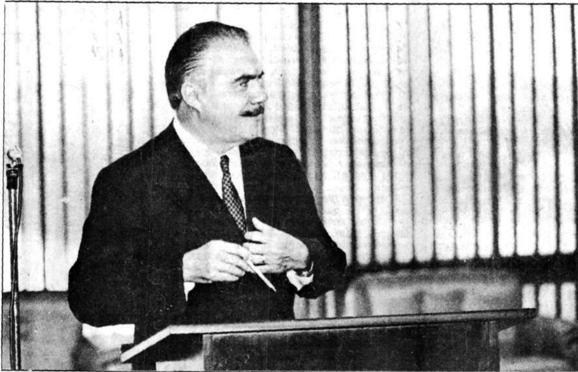
Sarney promete chamar líderes para novas decisões no projeto político

que "a devolução à soberania popular do direito de eleger seus supremos mandatários inscreveu-se no objetivo primeiro do "Compromisso com a Nação" — produto do ajuste de forças políticas reunidas na Aliança Democrática, que empolgou a sociedade brasileira e levou à vitória a chapa liderada pelo imperecível presidente Tancredo Neves".