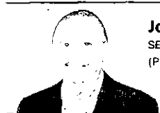
José Sarney SENADOR (PMDB-AP)

E u nunca achei que a cobiça pelo petróleo estivesse nas motivações da guerra de Bush ao Iraque. Achava delírios de radicais. Minha ingenuidade acabou quando li a autobiografia de Alan Greenspan, homem símbolo de uma época de glória do Banco Central Americano, conservador e republicano. Lá estava com todas as letras: "A Guerra no Iraque foi feita por causa do petróleo". Considerei-me um bobo, ao ter acreditado que isso era um insulto e calúnia, obra de xiitismo. Até a farsa das armas de destruição em massa estavam para mim à frente do petróleo.