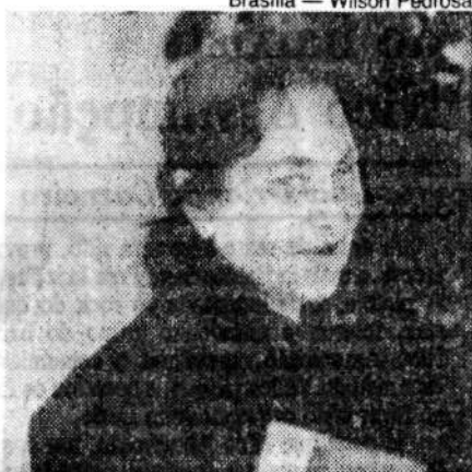
Novikova põe Sarney em russo

lado escritor, e as iniciativas brotam, espontâneas, de editoras dos mais diversos idiomas. Principalmente de países em vias de ser visitados por ele.