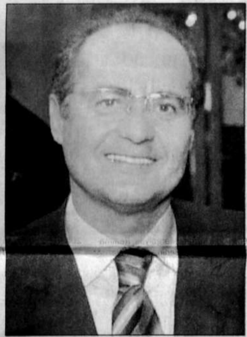
No elegante jantar, o presidente do Senado, Renan Calheiros