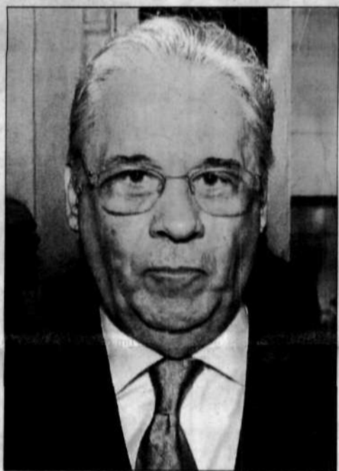
Na noite, o ex-presidente Fernando Henrique Cardoso