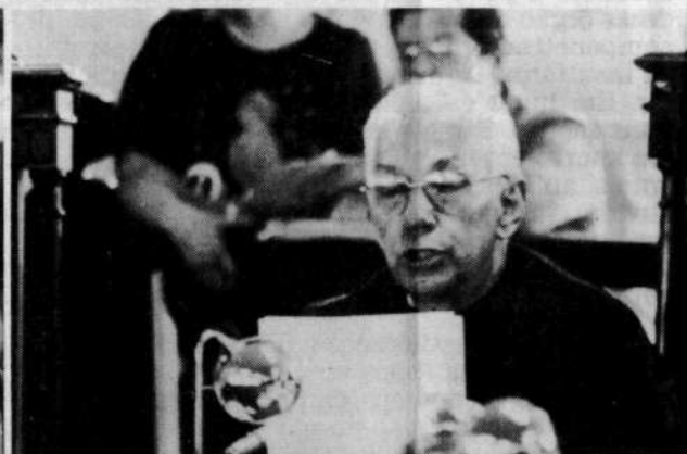
... indeferida pelo parecer do relator Seixas.

O presidente José Sarney quer saber, efetivamente, quem está com ele em momentos decisivos para evitar desgastes na Aliança Democrática, e sua reação será na mesma intensidade da solidariedade que lhe for conferida. Ou seja, o governo ficará à vontade para ajudar apenas os parlamentares que defenderem seus interesses no Congresso Nacional.