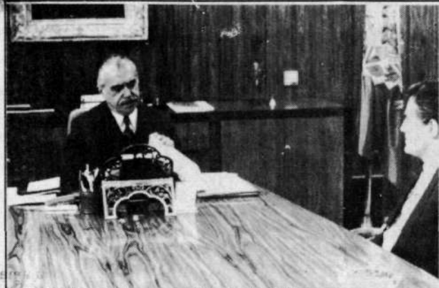
Sarney, aborrecido com os "dissidentes", deu...

O presidente quer saber com quem pode realmente contar nas horas difíceis. Quem não ajudar o governo não será ajudado.