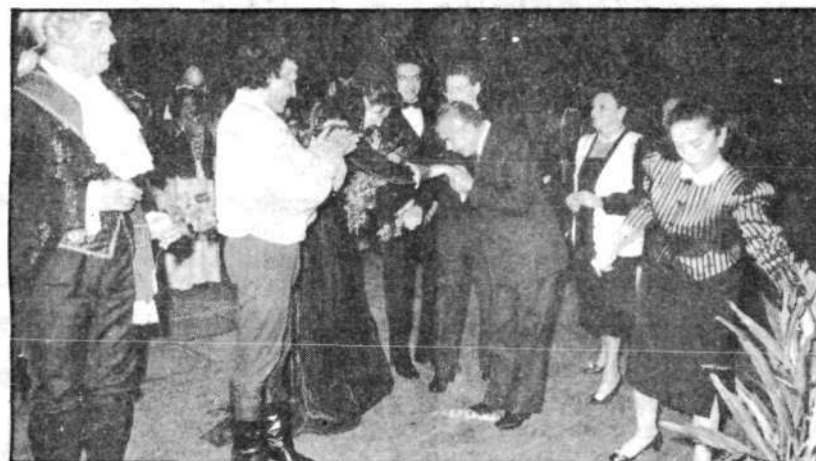
A frente de D. Marly, o Presidente Sarney cumprimenta no palco a cantora Sylvia Sass