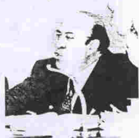
Suassuna relata patentes

Já a análise da polêmica surgiu por ocasião da apuração dos votos do Congresso que derrubaram a vinculação do crédito rural à variação da TR ficou a cargo do senador Bernardo Cabral (PP-AM). A liderança do governo contestou a validade de quatro votos, alegando que estavam rasurados. Se esses votos forem invalidados os opositores da vinculação das taxas do crédito rural à TR serão derrotados. Se o parecer do senador amazonense for