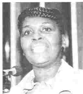
Benedita da Silva

- O dossiê mostra que o governo federal descumpra as leis, exclui a participação da sociedade, não abre espaço para o debate e atua em benefício dos oligopólios da área das comunicações. Mas os fatos registrados pelo documento também demonstram a responsabilidade do Legislativo e do Judiciário na alimentação dessa lei da selva em que se transformaram as comunicações no