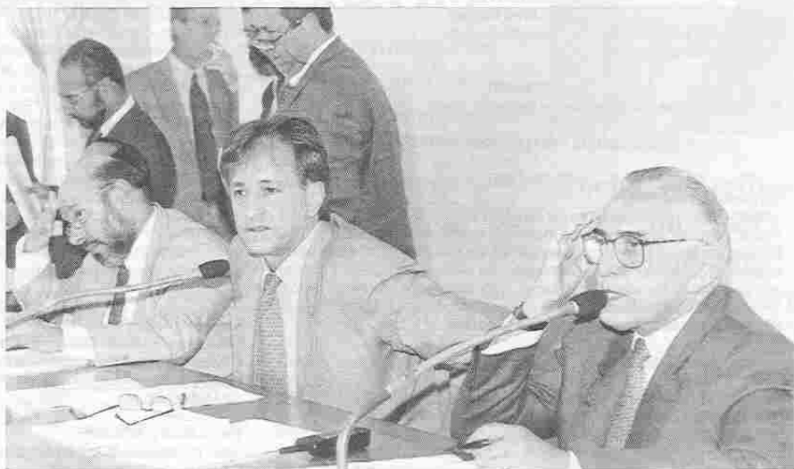
Francelino Pereira (E) preside a reunião da comissão especial, que teve como relator Gilberto Miranda