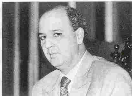
José Roberto Arruda